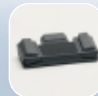
Comando a pedale 210